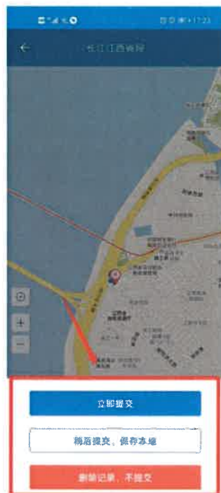
图 3-10 结束巡河

点击“结束”按钮，再点击“确认”按钮，根据提示选择“立即提交”，立即将巡河记录提交；或选择“稍后提交，保存到本地”，暂时将巡河记录保存在本地，在巡河记录中只有自己可见，可手动选择提交或删除；或者选择“删除记录，不提交”，删除本次的巡河记录。如果未填写日志，提交时，系统自动生成一条日志，记录为“无异常”。