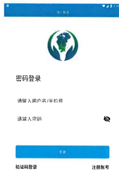
图 2-1 账号登录