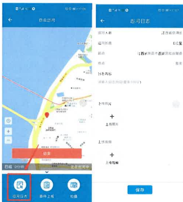
图 3-3 新增巡河日志

巡河过程中，点击“巡河日志”按键，填入信息，支持图片、视频上传，点击保存，巡河结束后再提交巡河日志。