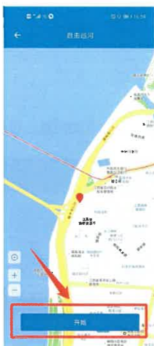
图 3-2 开始巡河