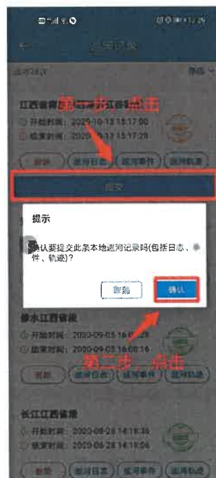
图 4-2 提交巡河记录