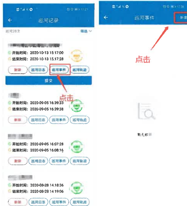
图 4-5 补录事件