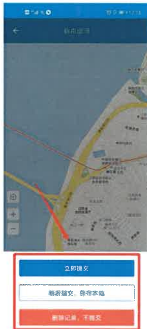
图 3-5 结束巡河