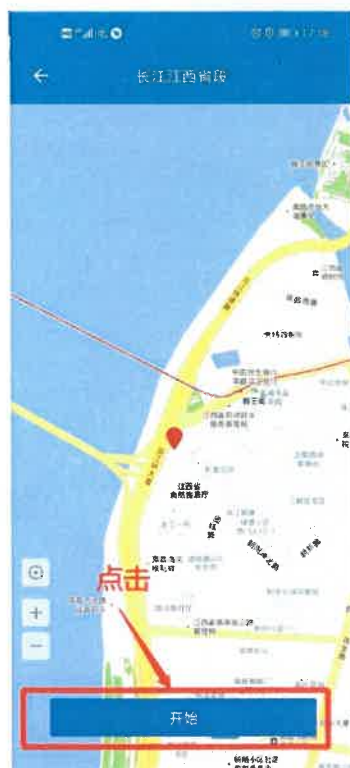
图 3-7 开始巡河