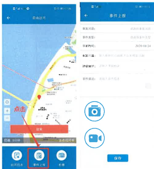
图 3-4 事件上报