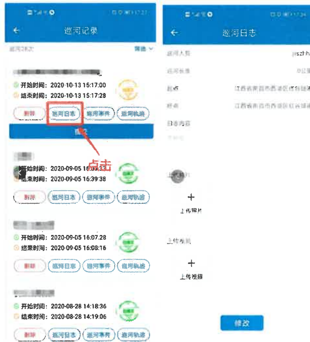
图 4-4 补录巡河日志