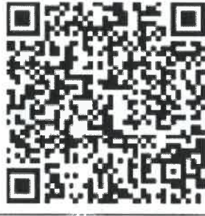
图 1-1 扫描二维码