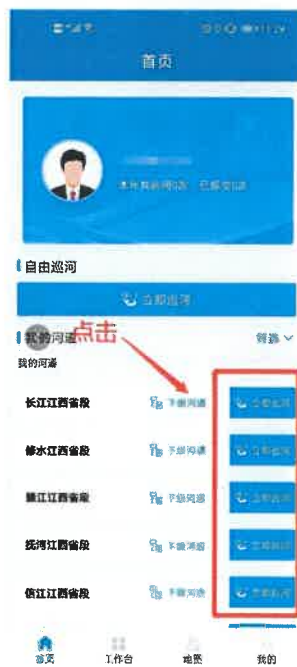
图 3-6 河道巡河

河道巡河可以选择当前登录用户管辖的河段进行巡河。点击“首页”中的河道巡查“立即巡河”。