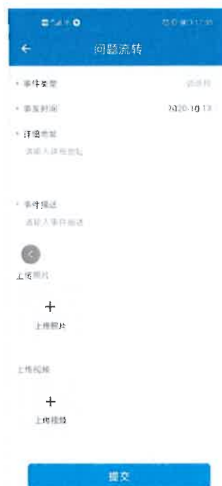
图 6-2 问题流转

问题流转，填写事发地区、详情位置、事发河道等信息，也可以上传图片和视频，点击“提交”按钮。