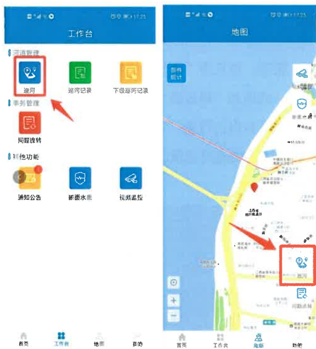
图 3-11 巡河模块