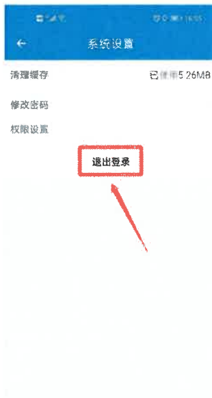
图 7-1 退出登录