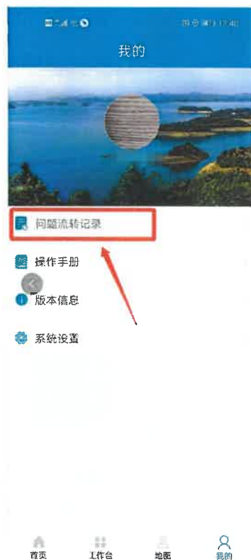
图 6-3 查询流转记录

已提交的问题，在“我的”版块，“问题流转记录”中查询，可以查询问题详情及处理结果。