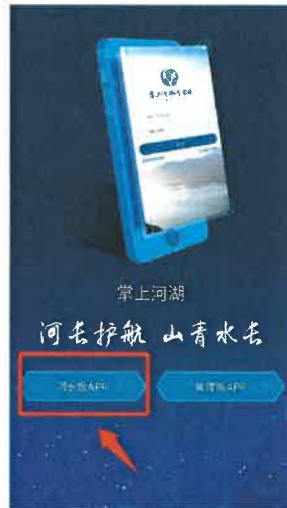
图 1-2 下载