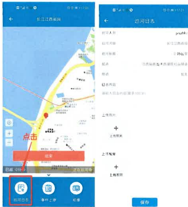
图 3-8 新增巡河记录