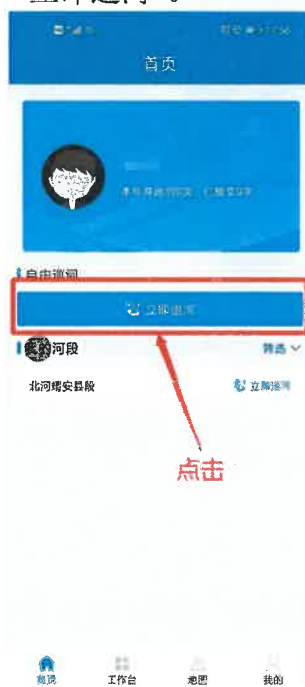
图 3-1 自由巡河

自由巡河可以巡查乡村级或系统中没有的河段，可以自由填写巡河的河段名称。点击“首页”中的自由巡河“立即巡河”。