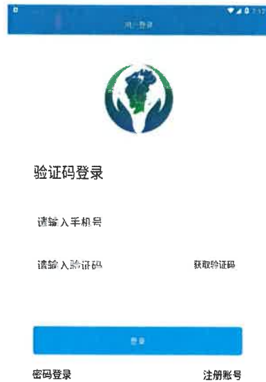
图 2-2 手机号登录

APP 支持手机号码登录。点击上图左下角“验证码登录”，输入用户手机号，点击“获取验证码”，输入验证码，单击“登录”，即可登录成功。