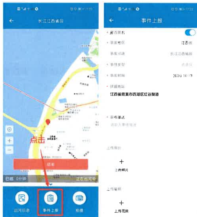
图 3-9 事件上报