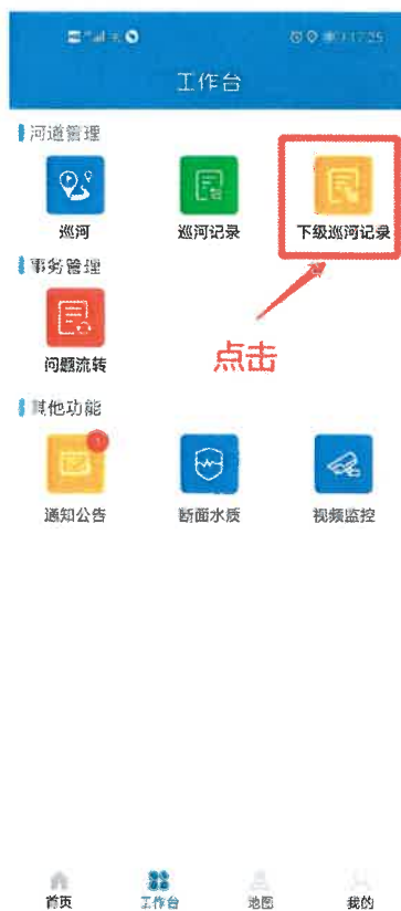
图 5-1 下级巡河记录查询