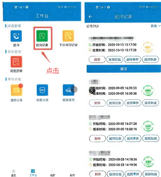
图 4-1 查询巡河记录