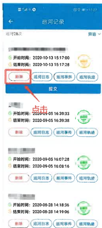
图 4-3 删除巡河记录